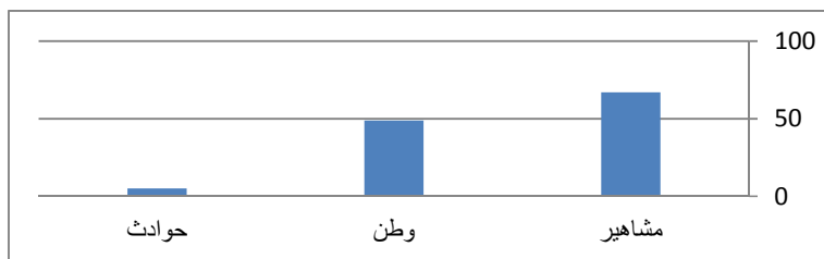
نمودار بسامدی انواع مرثیه اجتماعی

خوابم نمی‌ربود نقش هزار گونه خیال از حیات و مرگ، در پیش چشم بود شب در فضای تار خود آرام می‌گذشت از راه دور، بوسه سرد ستاره‌ها مثل همیشه بدرقه می‌کرد خواب را. در آسمان صاف... که در مرگ زندگی ست! (همان: ۴۷۸)